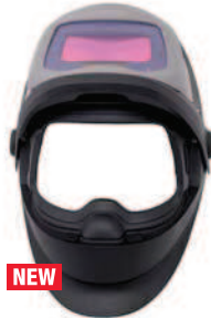
Заваръчен шлем 3M™ Speedglas™ 9100 FX