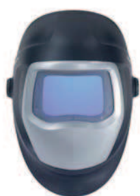
Заваръчен шлем 3M™ Speedglas™ 9100