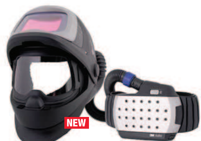
Заваръчен шлем 3M™ Speedglas™ 9100 FX Air