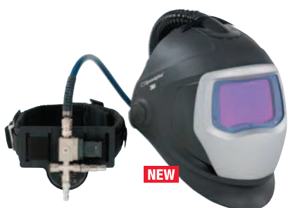
Заваръчен шлем 3M™ Speedglas™ 9100 Air

За да откриете разликата, обадете се на местния представител на 3M™ за демонстрация.